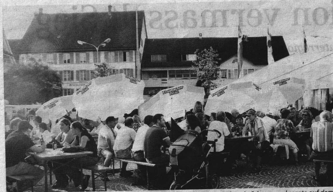
Der neue Treffpunkt wurde gleich in Beschlag genommen: Die Bevölkerung kam in Scharen und sorgte auf dem Dorfplatz für eine fröhliche Stimmung.

Der weitere Abend wurde mit solidem 70er-Jahre Rock von der Band «Masterpflaster» versüsst. Der Bar- und Festbetrieb bis in die Morgenstunden ebnete so die zukünftige festliche und hoffentlich erfolgreiche Karriere des neuen Villmerger Dorfplatzes. --fm