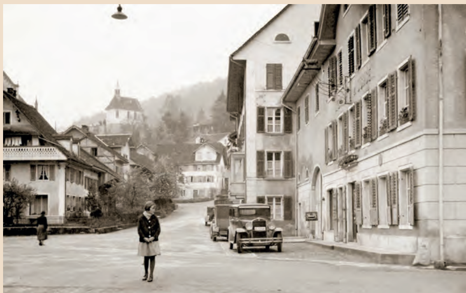
Bild aus Wörtertruckle: Dorfplatz ca. 1935

Freitag, 11. November 2022, 19.00 Uhr in der Mehrzweckhalle «Dorf» / Türöffnung 18.30 Uhr