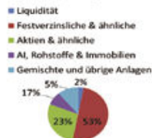
Vermögensstruktur nach Anlagekategorien