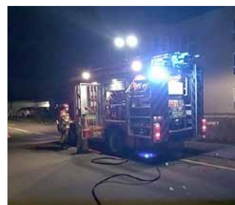
Ein Tanklöschfahrzeug beim Einsatz an der Eichmattstrasse. zg

Feuerwehrangehörigen wurde nötig, weil ein Feuer nicht sachgemäss gelöscht worden war. Bereits vor Ostern rückte die Feuerwehr zweimal aus. Am Mittwoch zu einem Keller, der wegen eines Rohrbruchs unter Wasser stand. Die acht Mann starke Truppe pumpte das Wasser ab und entfernte das Restwasser mit Saugern. Ebenfalls Leck geschlagen hat am Donnerstag eine Gülletransportleitung. Vier Feuerwehrleute spülten die Strasse und säuberten einen Schacht. pin/zg