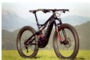
Eine Saison unterwegs mit dem Turbo Levo von Specialized.