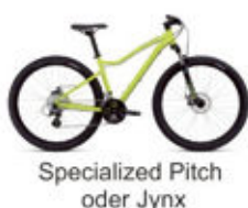
Specialized Pitch oder Jynx