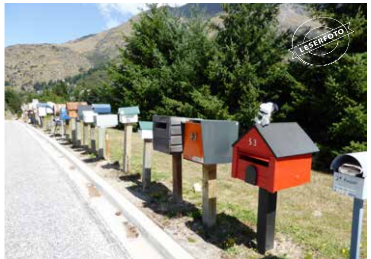
Die Post ist da! in Marleys (Neuseeland), einem kleinen Dorf mit 35 Einwohnern.