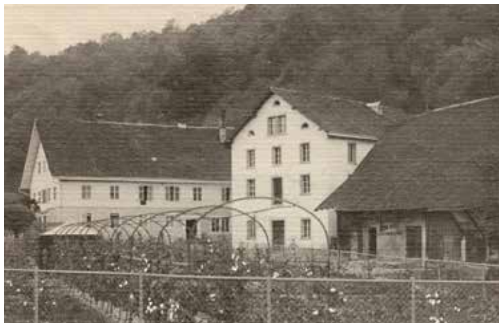
Die Obere Mühle – hier steht seit 1977 das Seniorenzentrum.