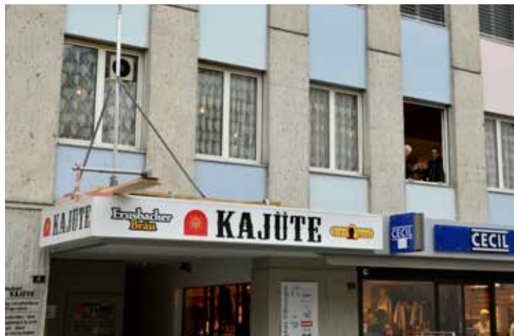
Zivko Atanasov freut sich mit seinen Gästen im Café Kajüte auf die Terrasse, welche voraussichtlich im Juni bezogen werden kann.

Vorausgesetzt, es gehen keine Einsprachen ein (das Baugesuch ist in dieser Ausgabe publiziert), soll im Mai mit der Montage der Stahlbaukonstruktion begonnen werden. Nach einer Bauzeit von rund drei Wochen können die Kajüte-Gäste im Juni ihren Kaffee draussen in luftiger Höhe geniessen. Das benötigte Mobiliar wird aber bereits früher angeschafft, «damit die Kajüte an sonnigen und warmen Frühlingstagen