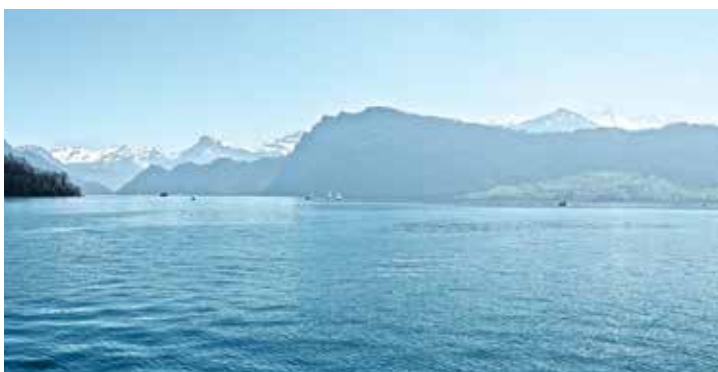
Mit dem SRK den Blick auf den Vierwaldstättersee geniessen.

Die Regionalstelle Freiamt des Schweizerischen Roten Kreuzes (SRK) Aargau lädt behinderte und ältere Mitmenschen am Montag, 13. Juni zu einem Tagesausflug an den Vierwaldstättersee ein.