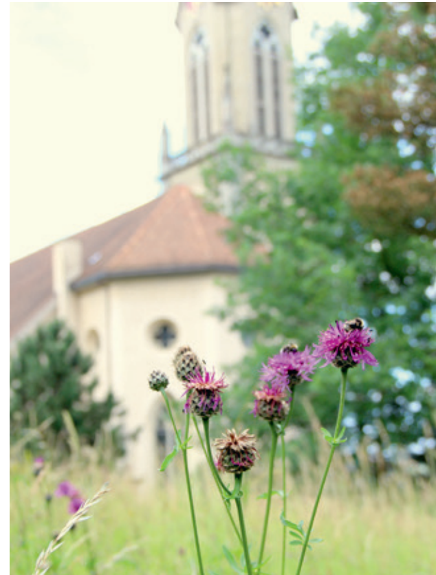
Einheimische Pflanzen zieren das Löwenareal vor Kamin und Kesselhaus der ehemaligen Färberei.