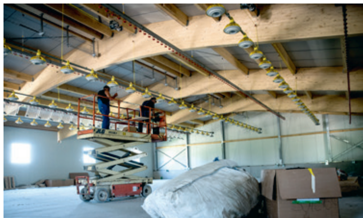
Hier werden sich schon bald tausende Hühner tummeln.

In Hilfikon wird derzeit ein neuer Mastpouletstall gebaut. Am Wochenende vom 18. und 19. Juli kann die fertige Geflügelhalle von der Bevölkerung besichtigt werden. Die «Villmerger Zeitung» hat gemeinsam mit einer bekennenden Poulet-Kritikerin bereits jetzt einen exklusiven Blick hinter die Kulissen gewagt.