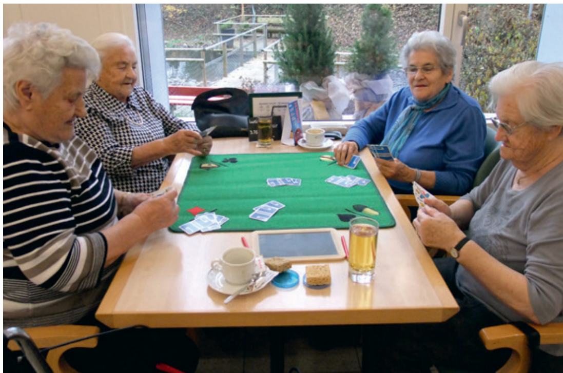
Jeden Dienstag wird im Seniorenzentrum mit Hingabe geasst.