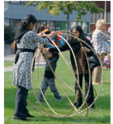
Spass für Erwachsene und Kinder: Das jährliche Spielfest.