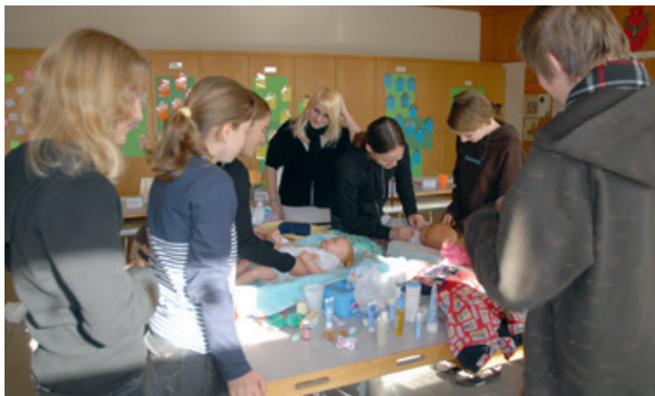
Auch Babysitten will gelernt sein: Eines von vielen Kursangeboten des Vereins.

wenn wir uns einer bestehenden Organisation anschliessen», erzählt sie. Als Unterorganisation einer schweizweit vernetzten Elternvereinigung erschien es einfacher, Fuss zu fassen und sich Gehör zu verschaffen. Und so hob man am 22. März 2005 gemeinsam mit rund zwanzig Gründungsmitgliedern die Villmerger Lokalsektion von Schule und Elternhaus aus der Taufe.