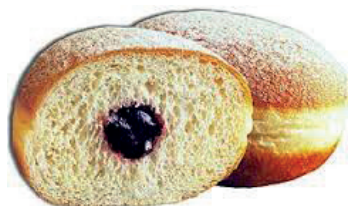
Am 18. Oktober findet ein Berliner-Schauback statt.

Warum dazu nicht mal eine Berliner, herrliche Vermicelles oder