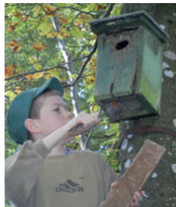
Wer hat sich wohl in diesem Nistkasten verkrochen?

Der Natur- und Vogelschutzverein NVV hat ein vielseitiges Herbstprogramm zusammengestellt, mit einem Filmabend und der Nisthöhlenkontrolle.