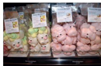
Neu im Sortiment: Meringues aus dem Emmental.

det ein Berliner-Schauback gleich vor der Bäckerei am Löwenplatz statt. Und zwar am Samstag, 18. Oktober, von 8 bis 13 Uhr. Hier können sich die Villmergerinnen und Villmerger vor