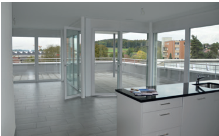
Die zwei Attika-Wohnungen sind noch zu haben.

Am Samstag benutzten viele Interessenten den Tag der offenen Tür, um die bezugsbereiten Miet-Wohnungen im Minergie-Standard am Löwenplatz zu besichtigen. Die Hälfte davon ist bereits reserviert.