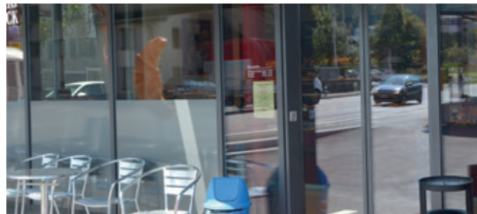
Köstlichkeiten aus Ihrer Bäckerei.