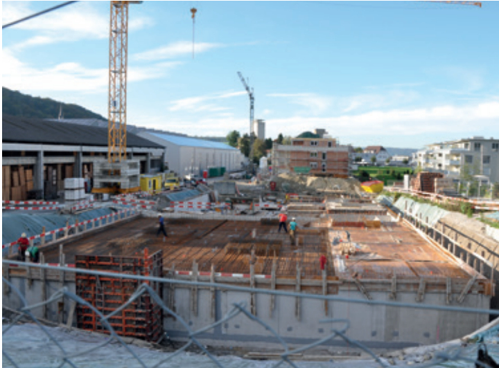
Entlang der Schützenhausstrasse kommen die beiden Mehrfamilienhäuser mit den Alterswohnungen zu stehen.

Die Firma Agensa Familia AG aus Herisau baut vier Mehrfamilienhäuser. Geplant war, dass in zwei Häusern ein Alters- und Pflegeheim untergebracht wird. Diese Pläne haben sich jedoch zerschlagen, der Bedarf an Pflegeplätzen in der Region ist gedeckt.