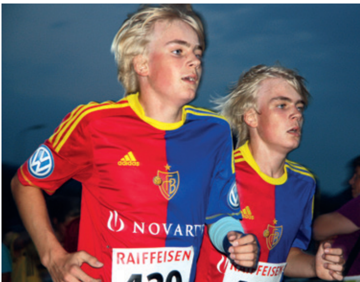
Auch in diesem Jahr werden die Läufer wieder alles für den guten Zweck geben.

Am Freitag, 5. September, findet der 14. «Batze-Lauf» auf der Badmatte statt. Der FC Villmergen und der Turnverein organisieren den traditionellen Anlass zugunsten der eigenen Nachwuchsförderung und des Seniorenzentrums.