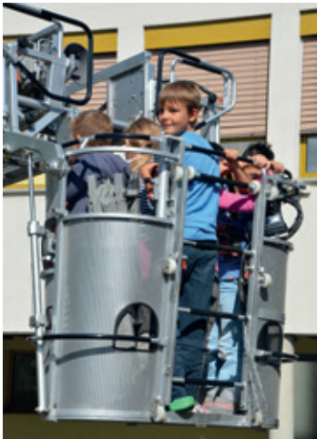
Für die Kinder war es ein Abenteuer.

Für die Kinder war es ein Abenteuer, auch wenn eigentlich der Ernstfall geprobt wurde. Denn welches Kind träumt nicht einmal davon, auf einer Feuerwehrleiter hoch über dem Boden zu schweben? Genau das erlebte eine Primarklasse, die von der Feuerwehr aus dem «brennenden» Schulhaus gerettet wurde. «Wir haben einen Brand im Treppenhaus si-