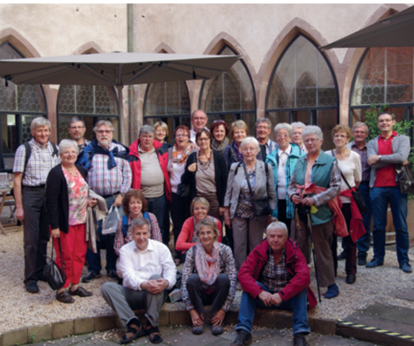
Der Cäcilienchor verbrachte einen interessanten Tag in der historischen Altstadt von Freiburg im Breisgau.