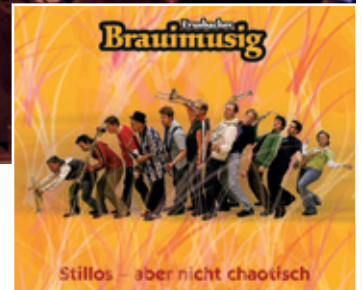
Die CD erschien 2006 und ist einer der Höhepunkte der «Braumusic».