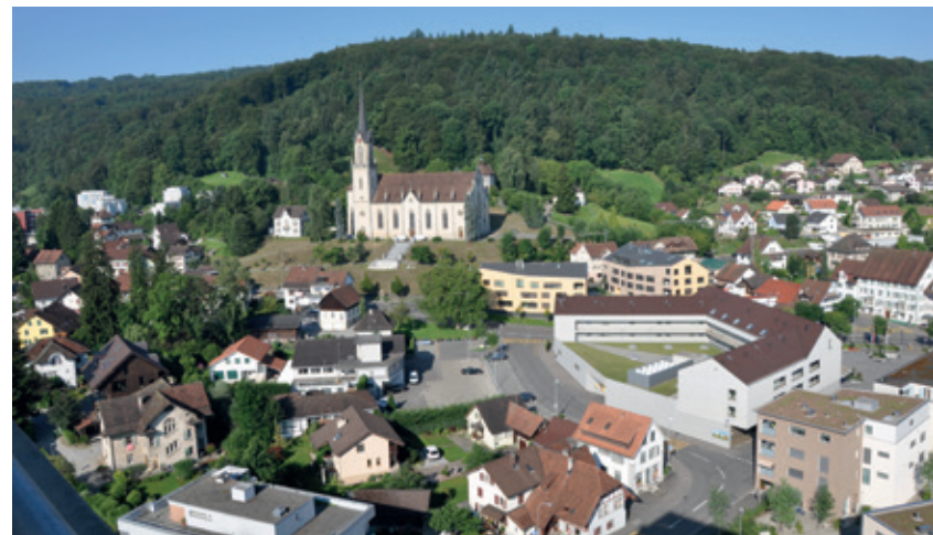
Der Standort der neuen Villmerger Kirche wurde lange und sehr kontrovers diskutiert.

acker jedem andern Bauplatz vorzuziehen sei. Dies aus folgenden Gründen: «Die neu erbaute Kirche kann von sämtlichen Pfarrangehörigen gesehen, und das Geläute von allen gehört werden. Die Kirche wird jeder Feuer- und Wassergefahr enthoben und gesichert sein. Der Beerdigungsplatz könnte um dieselbe herum