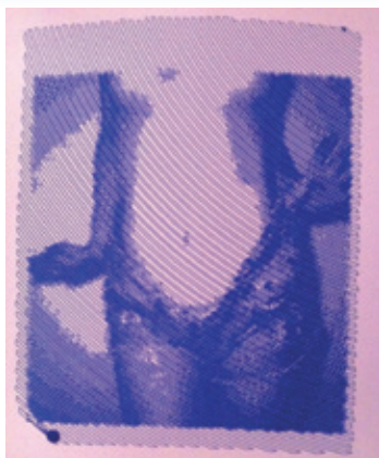
Momo Tourés Bilder entstehen mit einem Zeichnungsroboter.

seiner Ausbildung trennten, suchte er sich seine eigene Wohnung. Heute wohnt er im ehemaligen Armenhaus.