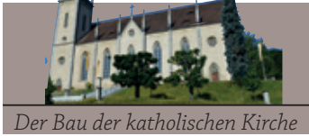
Der Bau der katholischen Kirche

Dorfhistoriker Otto Walti blickt zurück auf die wechselvolle Geschichte der Kirche. In der zweiten Folge erinnert er daran, wie kontrovers die Diskussionen um den Standortentscheid geführt wurden.