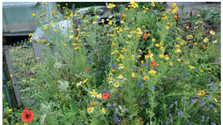
Haben das Ziel verfehlt: Die Blumen sollten die Schädlinge anlocken.

voller Enthusiasmus säte, hat ihr Ziel verfehlt. Eigentlich hätten die Blumen die Schädlinge anlocken sollen. Das taten sie aber nicht. «So eine Blumenwiese ist doch auch was Schönes», gewinnt sie