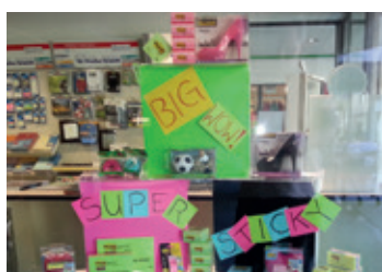
Bei WALFRA gibt es alle Artikel für den Schulanfang.

Schülerinnen und Schüler sowie angehende Lehrlinge brauchen das richtige Gerät, um die stren-