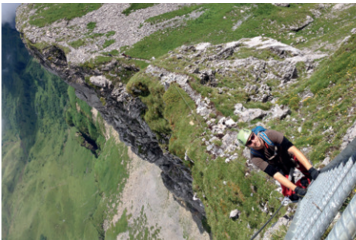
Der Klettersteig Braunwald ist auch für Einsteiger geeignet.

Adrenalin, gute Luft und schöne Aussicht sind garantiert. Zudem ist der Steig für Einsteiger und Fortgeschrittene sehr geeignet.