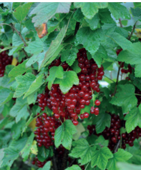
Aus den Johannisbeeren wird feiner Johannisbeer-Sirup.

Damit sich das Unkraut nicht in die Gartenbeete verteilt, streut sie jeweils Rasenschnitt auf die Wege. Dieser legt sich wie ein Teppich auf den Boden. Und wer bei Gurken oder Tomaten mit Mehltau auf den Blättern zu kämpfen hat, dem rät sie, dem Setzling nächstes Jahr etwas Brennessel beizugeben. «Ich habe den Tipp von einem alten Gärtner bekommen. Seit ich das anwende, habe ich nie mehr Probleme mit Mehltau gehabt», erzählt sie. Bald können die ersten Randen