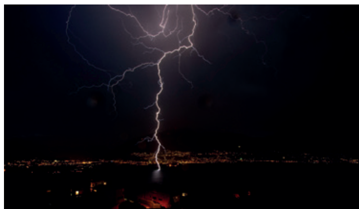
Die ganze Kraft der Natur auf einem Bild: Der Blitz von Thomas Meier.