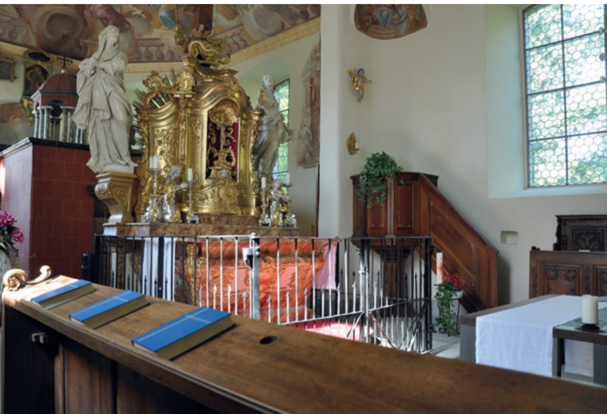
Seit der Renovation vor drei Jahren erstrahlt die Schlosskapelle Hilfikon in neuem Glanz.

Eine besondere Kapelle thront hoch über Hilfikon. In ihrem Innern steht nämlich die detailgetreue Nachbildung des Christusgrabes in Jerusalem. Die nächste Messe am Sonntag, 4. Mai, wird von einem Jodlerchor umrahmt.