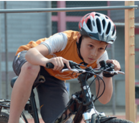
Einem tiefen Hindernis ausweichen, ohne zu stürzen – im Wald könnte das ein tiefhängender Ast sein.

Während der Frühlingsprojektwoche an den Villmerger Schulen konnten die Schülerinnen und Schüler aus vielen spannenden Themen wählen. Eine Gruppe versuchte sich sogar als Restaurantbetreiber.