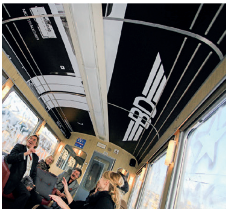
In den Nostalgiezügen der BDWM werden originelle Extrafahrten geboten.

Viele neue attraktive Angebote sind kreiert worden und warten nun auf genussfreudige Gäste. Unvergessliche Momente zu zweit oder mit Ihren Freunden. Wie wäre ein Start in den Sonntag mit einem genüsslichen Zmorge? Sind Sie ein Tatar-Fan oder lieben Sie thailändische Köstlichkeiten? Natürlich wird auch Deftiges angeboten: Eine urchige Metzgete. Steigen Sie ein und geniessen Sie nicht nur kulinarische Spezialitäten, sondern auch die Aussicht auf die wunderschönen vorbeiziehenden Landschaften. Haben Sie gewusst, dass diese Nostalgiezüge nebst den Genussfahrten auch ganz persönlich für Sie fahren? Eine originelle Extrafahrt, die auf Ihren Anlass zugeschnitten ist. Gründe zum Feiern gibt es viele – Geburtstag, Taufessen, Firmenjubiläum oder einfach Zusammen-