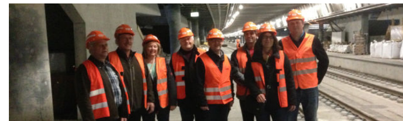
Die SVP zu Besuch auf der Baustelle der Durchmesserlinie.

Die Mitglieder der SVP Villmergen-Hilfikon zog es am 3. Mai über die Kantonsgrenze. Die Reise führte hinaus nach Zürich. Dort stand die Besichtigung der Durchmesserlinie (DML) auf dem Programm. Die DML ist die grösste innerstädtische Baustelle der Schweiz. Sie verbindet die Bahnhöfe Zürich–Altstetten, Zürich–Hauptbahnhof und Zürich–Oerlikon und bringt für den Hauptbahnhof Entlastung. Darüber hinaus sorgt sie für Fahrplanstabilität in der ganzen Schweiz. Die Kosten für die Durchmesser-