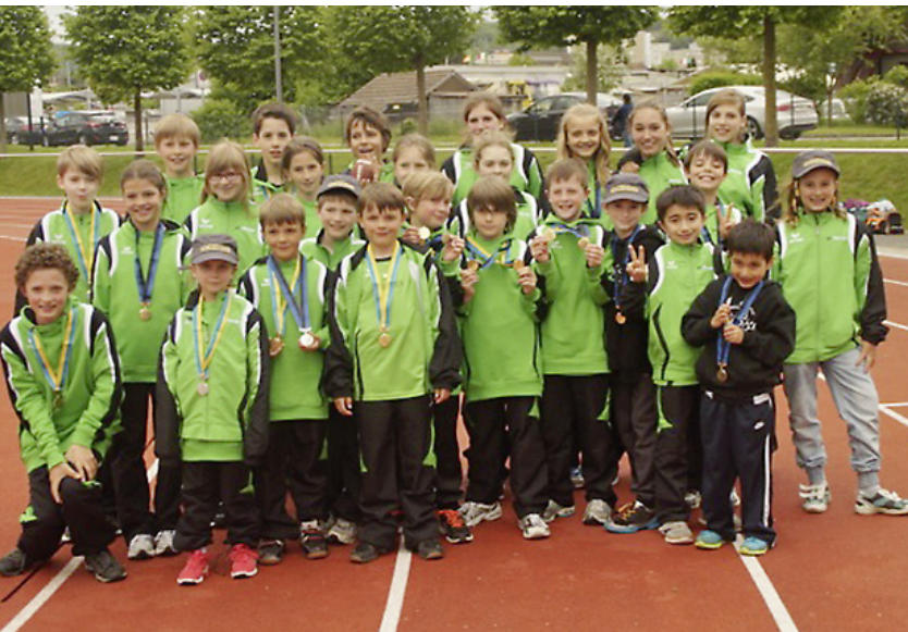
Die Kinder präsentieren stolz die gewonnenen Medaillen.

Die LA Villmergen sicherte sich am regionalen UBS Kids Cup in Wohlen insgesamt 20 Medaillen.