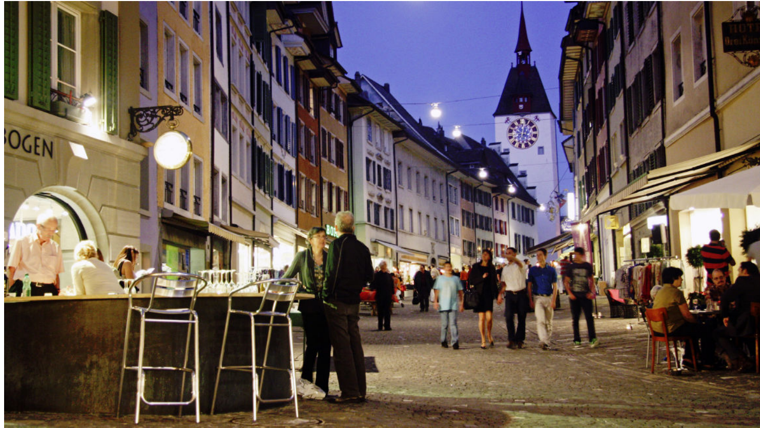
Auch beim nächsten Vollmondshopping am Samstag, 25. Mai, wird wieder reges Treiben in der Bremgarter Altstadt herrschen.

Das Vollmondshop-ping in Bremgarten erfreut sich grosser Beliebtheit und lockt regelmässig zahlreiche Einkaufs- und Schaulustige ins Reussstädtchen. Viermal im Jahr haben die Geschäfte in der Bremgarter Altstadt bis 22 Uhr geöffnet: Shopping in einmaligem Ambiente.