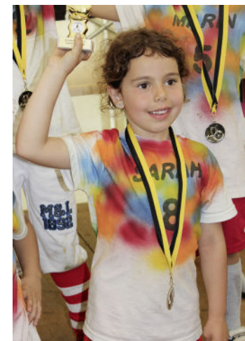
Die Medaillen und Pokale waren der verdiente Lohn für den grossartigen Einsatz auf dem Spielfeld.

trugen zum grossen Erfolg bei. «Wenn die Kinder sich gegenseitig anfeuern, ihre Parallelklassen