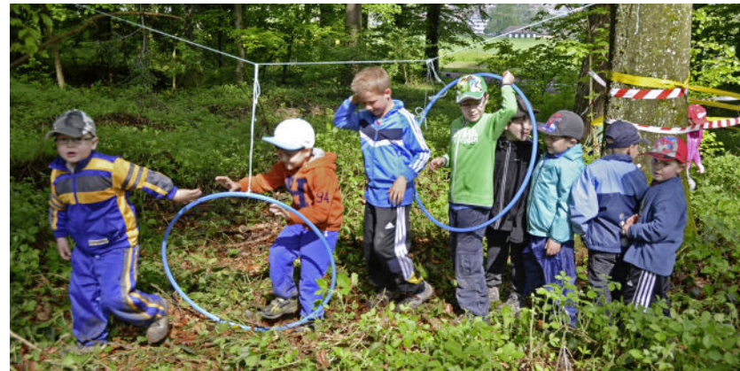
Die Kleinsten hatten bei unterhaltsamen Spielen viel Spass im Wald.

besten gefallen», strahlt Angelo und rennt hungrig Richtung Brätlistelle davon.