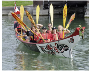
Auf der Litonya: Reisen wie früher die Küstenbewohner Kanadas.