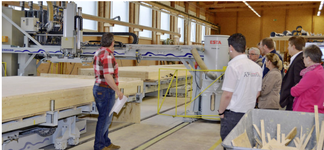
Besonders die CNC-gesteuerte Produktionsanlage beeindruckte die interessierten Besucher.