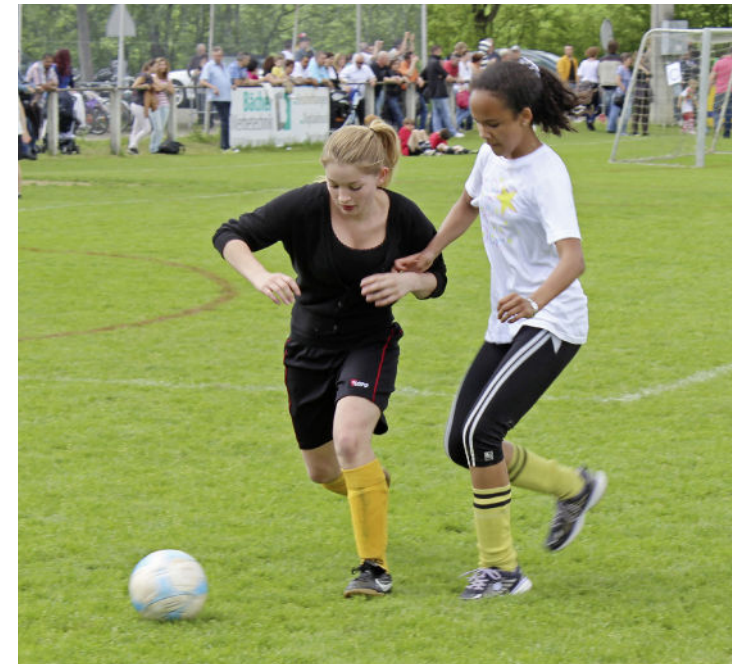
Viele Mädchenteams nahmen am diesjährigen Schülerturnier teil.

Die Teilnahme ist für alle gratis, wer mitmacht, erhält ein Sandwich und ein Getränk und am Schluss eine Medaille. Unzählige freiwillige Helfer waren mit