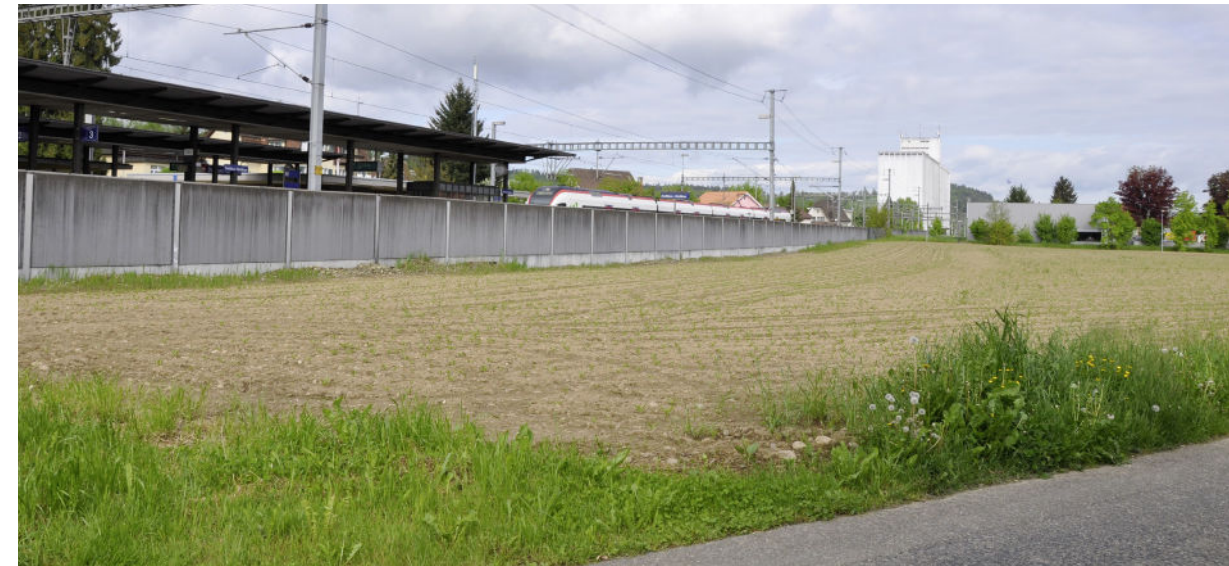
Auf der Wiese beim Bahnhof Dottikon-Dintikon, auf einer Fläche von 1080 Quadratmetern Land, hätte die Gemeinde den naturnahen Spielplatz realisieren wollen.