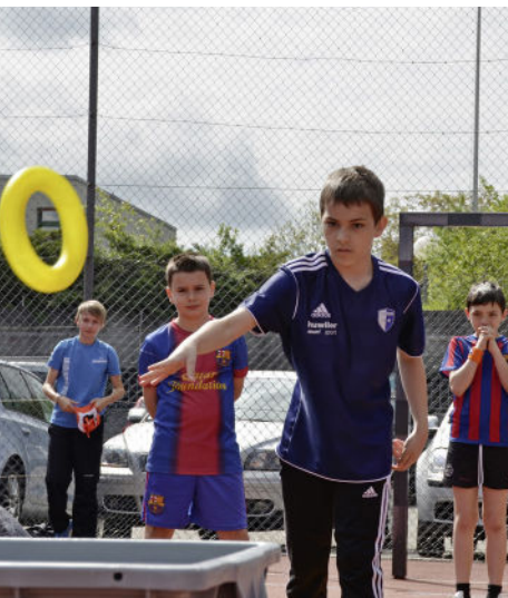
Volle Konzentration beim Werfen.

Der Sporttag der Mittelstufe bot einen abwechslungsreichen Mix aus Leichtathletik und Spielen.