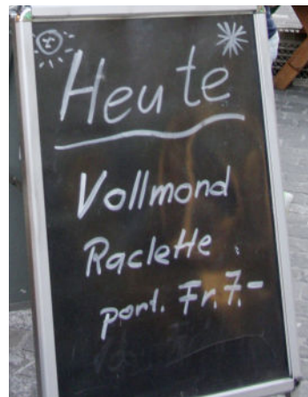
Stets mit kulinarischen Highlights.