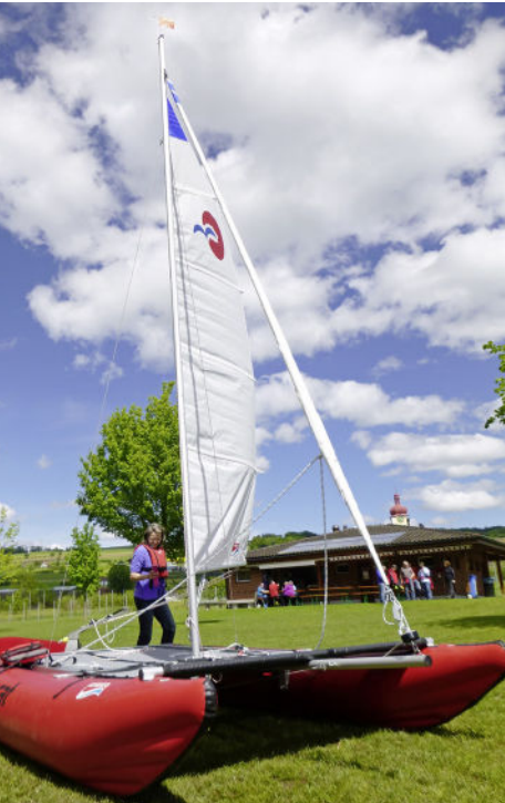
Bei schönstem Wetter Boote getestet.

Beim Sportgeschäft Stöckli in Boswil wird in der wärmeren Jahreszeit Wassersport grossgeschrieben. Es werden Erlebnisfahrten für ganze Gruppen angeboten.