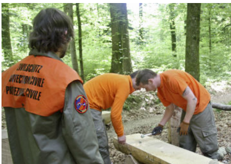
Auch neue Bänke wurden erstellt.